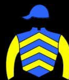
STUD EL TRI