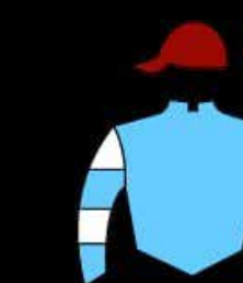
STUD JUAN DE ARONA