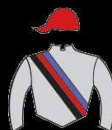
STUD BLACK LABEL