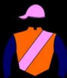
STUD MISS EMILITA