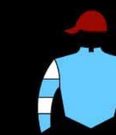
STUD JUAN DE ARONA