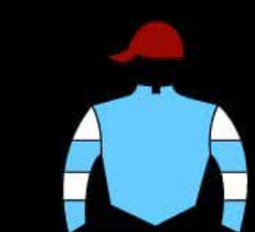
STUD JUAN DE ARONA