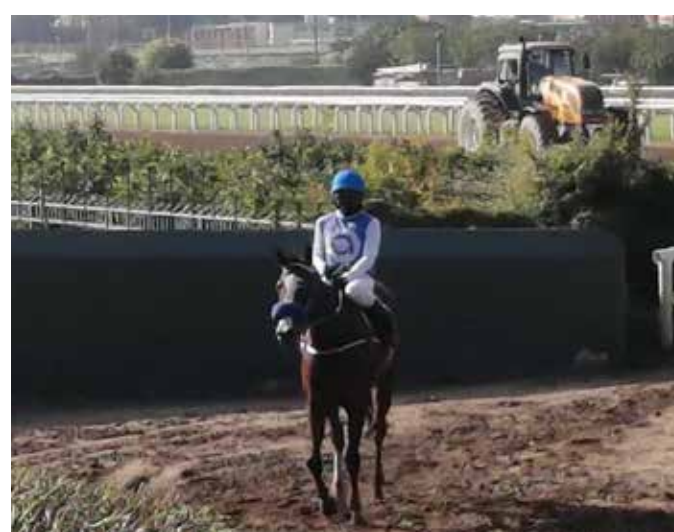
Dominus Princess Dinero seguro

Dominus Princess , 600 en 34" muy bien. Espalmador , 600 en 34"3 en gran forma. Ukrano , 24"4 del partidador, sale para pelearla. Macropoli , 24"1 del partidador, muy bien. Flanders Girl , 27"4 para 500 metros, rematando de subida, en pelo. Excelente.