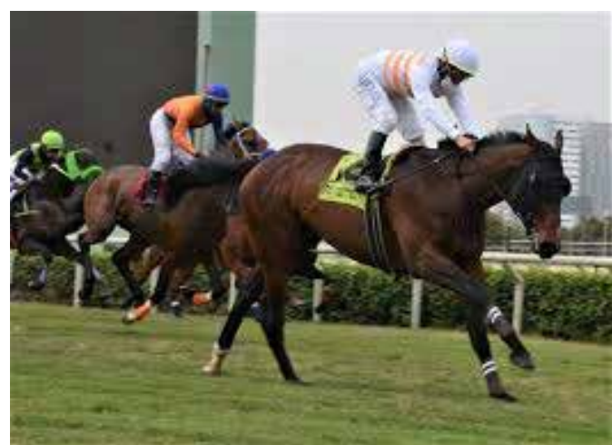
VACACIONAL A ratificar su talento

Tsarina Sophia , 600 en 34" veloz. Astu , 1000 en 1'00"4 en gran forma, sale a ganar. Vacacional , 800 en 48" rematando de subida. Ancestro , 700 en 41"2 excelente, estrena preparación. Bella Ciao , 400 en 23"4 desde la gatera. Aroma a Mar , 600 en 36" veloz. Ojo.