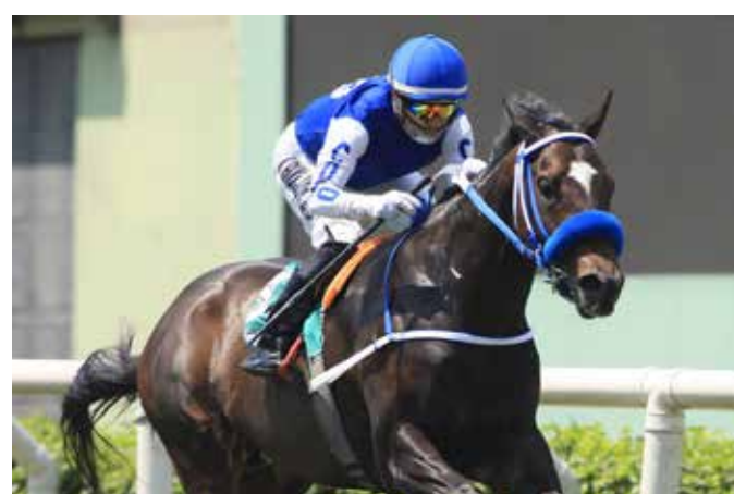
SPORTING LORD Transformado

Bartolo , 700 en 41" con 11"2, parando en 55", es su carrera. Sporting Lord , 400 en 22" con Carlos Trujillo. Bacco , 700 en 40" con 11"3 estupendo. Jack The Ripper , 1100 en 1'09" muy bien, se puso en condiciones.