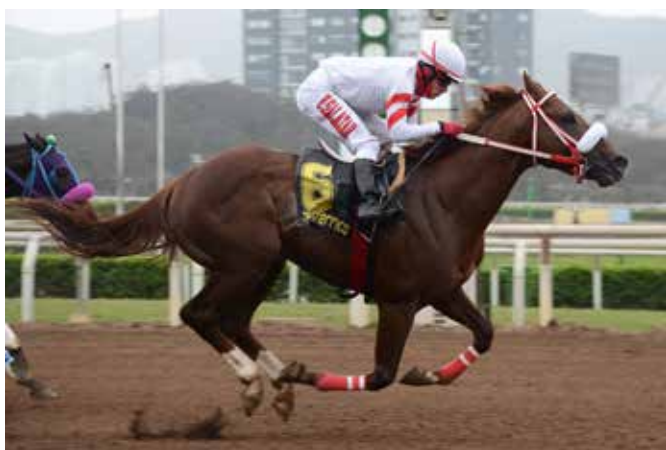
SENSEI Olviden su última

Gaeta , 600 en 37" tranquila. The Moonlite , 300 en 19" desde el partidador. Sale con full aprontes. Sensei , 600 en 33"4 volando en corto. Super Época , 400 en 24" fácil, desde la gatera.