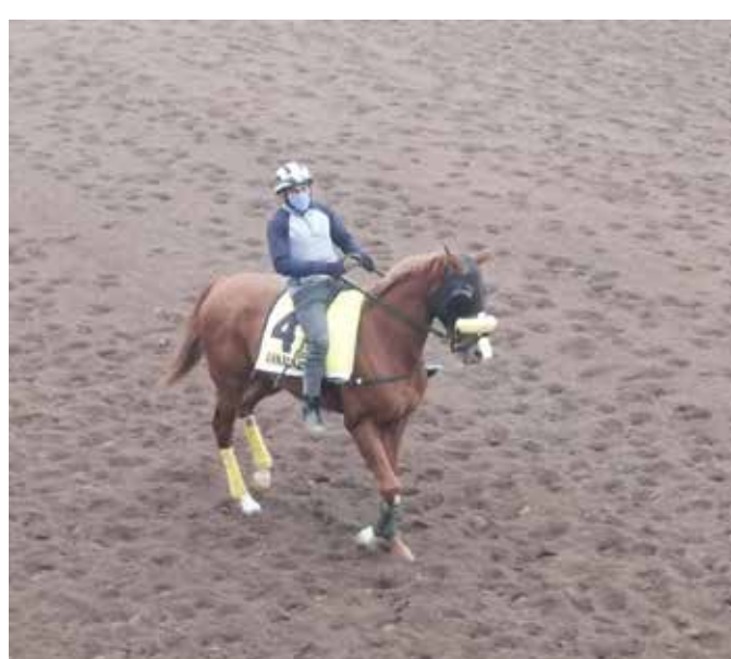
ANNAGRAZIA En su mejor momento

MAGGIE GRACE , 400 en 25" se levantó de manos, pero recuperándose para superar a Sucedida. Es buena debutante. CENTAINE , 300 en 19" un pique con Chuan. Sale a ganar. TEATRO CLÁSICO , 700 en 42"1 del partidador con Motaban. ANNAGRAZIA , 1500 en 1'38"3 en pelo, del 6 al 9, rematando de subida, en gran estado.