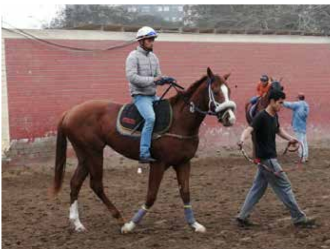
KIRIN Es bravo en la recta