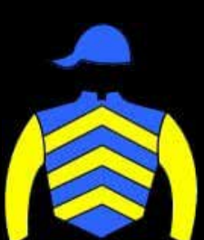
STUD EL TRI