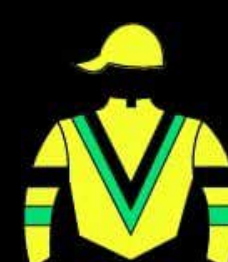
STUD LOS MUCAS