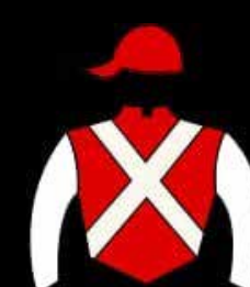
STUD LA PUREZA