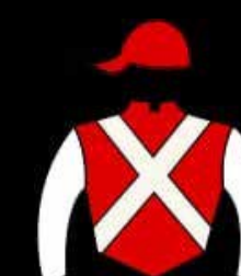
STUD LA PUREZA