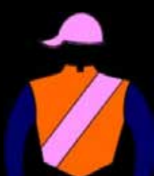
STUD MISS EMILITA