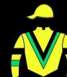
STUD LOS MUCAS